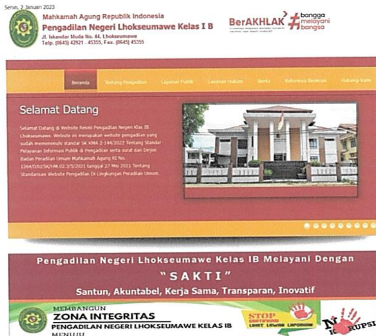
Gambar 1. Website Pengadilan Negeri Lhokseumawe Kelas IB

Informasi-informasi yang ditampilkan dalam website Pengadilan Negeri Lhokseumawe bertujuan sebagai pelayanan pengadilan kepada masyarakat pada umumnya, sebagai implementasi dari Undang Undang Republik Indonesia Nomor: 14 Tahun 2008 tentang Keterbukaan Informasi Publik dan SK KMA Nomor: 2-144/KMA/SK/VIII/2022 tanggal 30 Agustus 2022 tentang Standar Pelayanan Informasi Publik Di Pengadilan, khususnya informasi tentang proses peradilan, informasi perkara, jadwal sidang, publikasi putusan, layanan publik, layanan hukum, sarana dan prasarana serta informasi lain-lain yang dibutuhkan oleh masyarakat dan pihak-pihak yang mencari keadilan (justiciabelen).